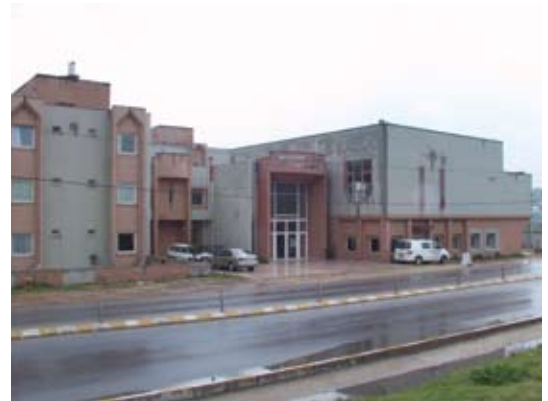
Çerkezköy Sosyal Tesisleri

Türk Metal, üyelerine her aşamada sosyal hizmetler verebilmek amacıyla, muhtelif şehirlerde sosyal tesisler inşasını da sürdürüyor. Bu tesislerden ilkinin temeli, 21 Kasım 1994'te Kırıkkale'de atıldı. İkinci sosyal tesisinin temeli 3 Aralık 1994'te Çerkezköy'de atıldı. Çerkezköy'deki Sosyal Tesisimiz tamamlanarak hizmete açılmıştır.