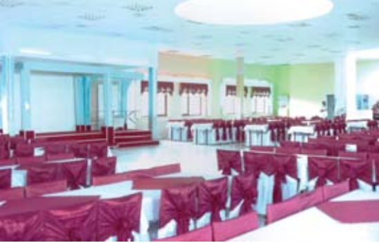
Kaynarca Sosyal Tesisleri Düğün ve Toplantı Salonu