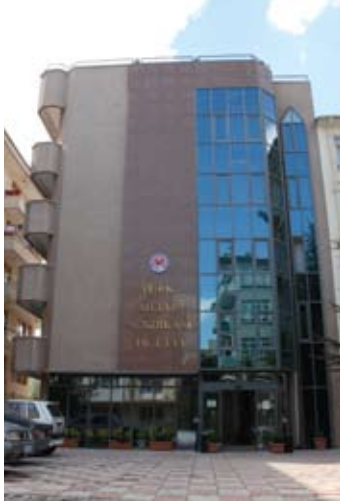
Ankara Maltepe İşçi Evi

Şu anda 30 oda ve 60 yatak kapasitesi bulunan bu işçi evi, Ankara dışından ailece gelen sendika üyelerine, çok cüzi bir ücret karşılığında, 4 yıldızlı otel seviyesinde konaklama imkânı sunmaktadır.