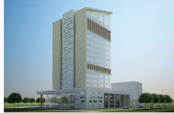
Büyük Anadolu Ankara Otel Projesi

Türk Metal Sendikası üyeleri açısından gelecek için bir sigorta anlamı taşıyan otel aynı zamanda metal işçileri ve aileleri için bir eğitim yuvası olacaktır.