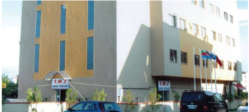
İstanbul Pendik Kaynarca Sosyal Tesisleri

Sıcak su, uydu yayını, İnternet, tv, telefon gibi hizmetlerin 24 saat konaklayanlara sunulduğu sosyal tesislerimizin odalarında klima, minibar ve televizyon da bulunuyor.