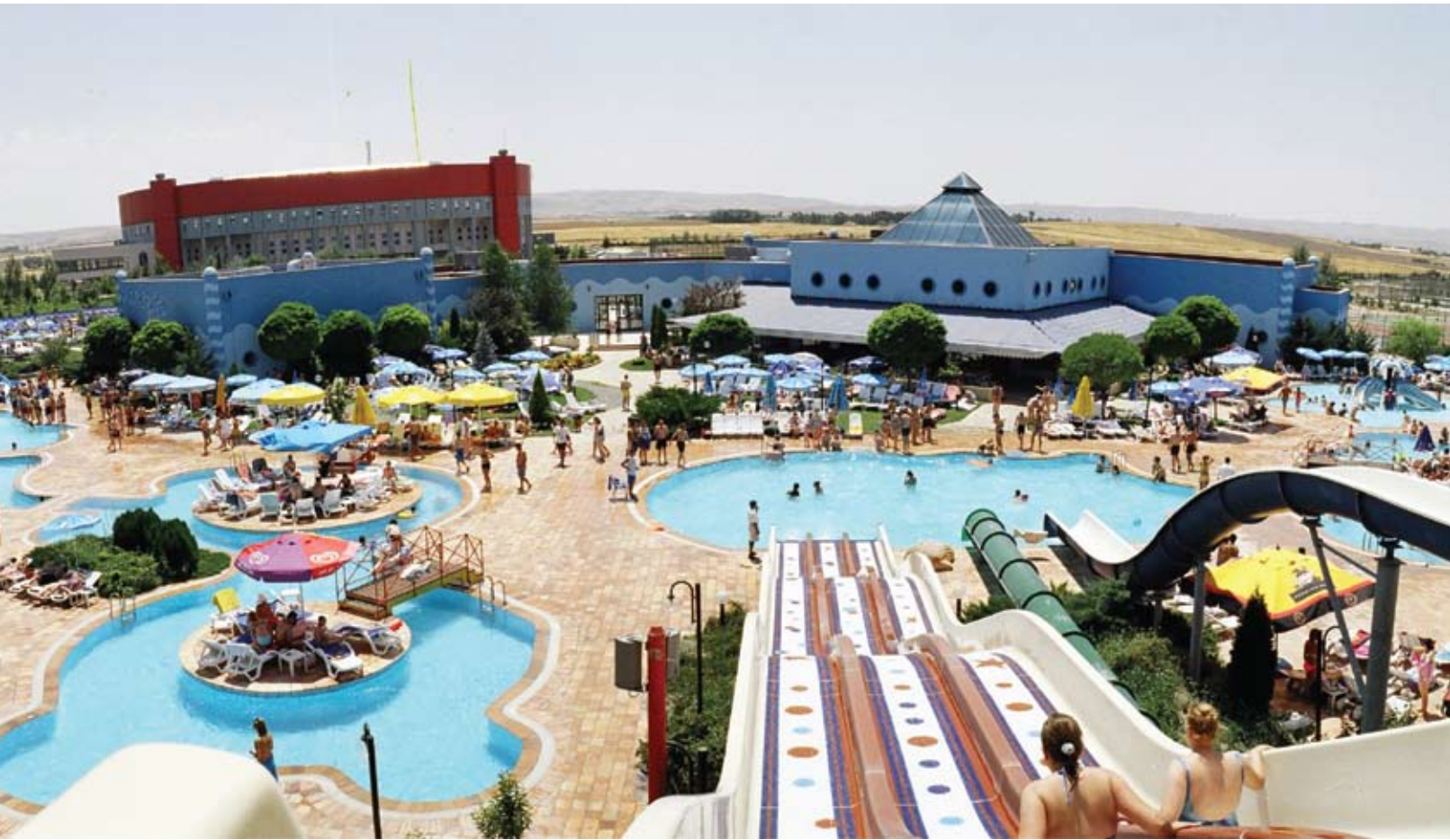
Büyük Anadolu Otel Komplexi içerisinde yer alan Aqua park ve 8 bin kişilik kapalı Spor Salonu...