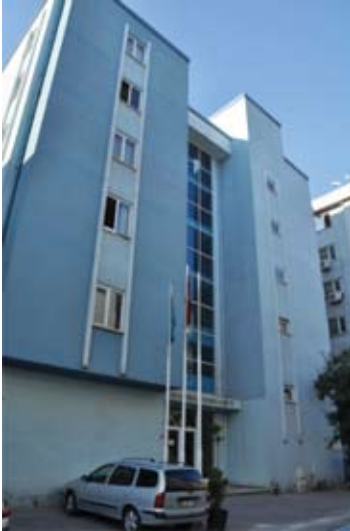
İstanbul Şirinevler Sosyal Tesisleri