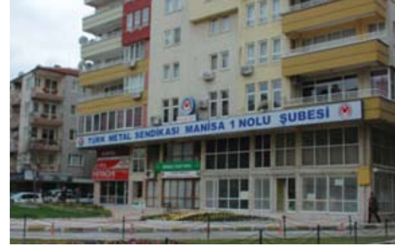
Manisa Sosyal Tesisleri

Binada aynı zamanda toplantı salonları ve restaurant bulunmaktadır.