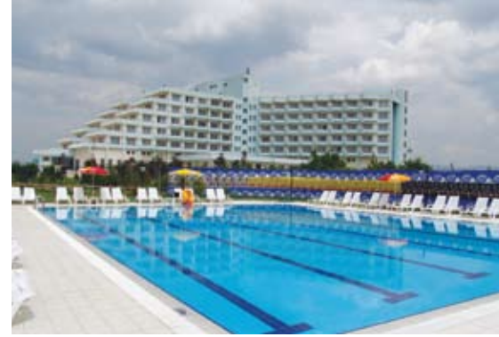
Büyük Anadolu Hotel Ankara

Aynı zamanda Türk Metal Sendikası ve üyelerinin "geleceğinin teminatı" olan bu dev tesislerin başında, Ankara/Akyurt'ta kurulan Büyük Anadolu Oteli'nin temeli 16 Ekim 1992'de atıldı. Dünyada hiçbir sendikanın sahip olmadığı bu dev tesis, günümüzde Türkiye'nin sayılı tesislerinden birisi durumundadır.