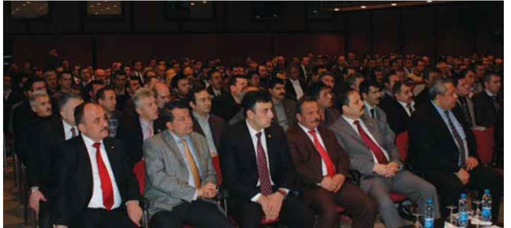
Genel Merkez Konferans Salonumuz

Genel Merkez binamız, sendikamızın çalışma ünitelerinin ihtiyaçlarına cevap verecek şekilde düzenlendi. Binanın alt katında her türlü toplantı, sempozyum, seminer gibi çeşitli etkinliklerin yapılabileceği çok amaçlı bir Konferans Salonu yer aldı. Zemin katında oto garajı, arşiv odası ve depo gibi kısımlar bulunuyor.