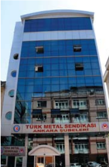
Ankara Kızılay Sosyal Tesisleri

Binada aynı zamanda toplantı ve konferans salonu bulunmaktadır.