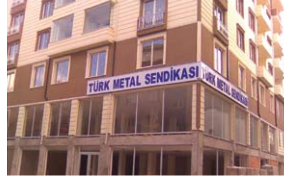
Bozüyük Sosyal Tesisleri

Bozüyük şubemizde hizmet vereceği tesiste aynı zamanda eğitim ve toplantı salonlarımızın yanı sıra şube lokalimizde, metal işçilerinin hizmetine açılacaktır.