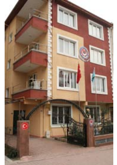
Çerkezköy Sosyal Tesisleri / Tekirdağ

Binada aynı zamanda toplantı, konferans ve eğitim salonları yer almaktadır.