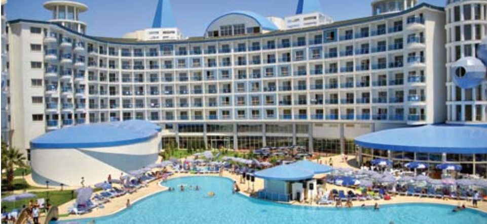
Büyük Anadolu Didim Resort Hotel Aydın