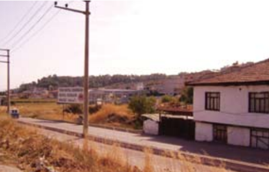
Bursa Sosyal Tesis Arsası