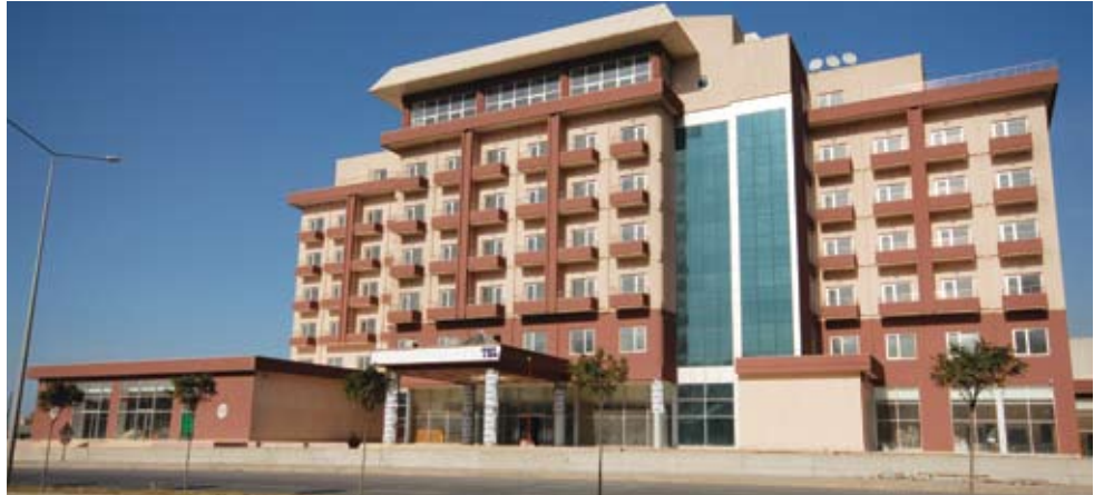
Büyük Anadolu Ereğli Otel

Büyük Anadolu Ereğli Otel, bölgenin en büyük sosyal tesisleri olmakla birlikte metal işçilerine karadeniz bölgesinde tatil imkanı sağlayacaktır.