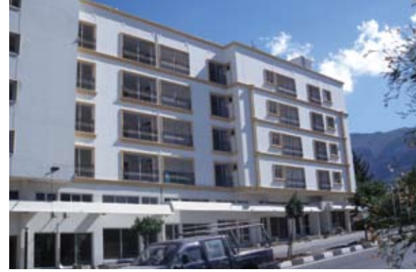
Kıbrıs Grand Avrasya Otelı

Grand Avrasya Otelı, 2009 yılında başlayan yenileme çalışmaları ile yepyeni ve daha kullanışlı bir görünümüne sahip olarak 2011 yılının ilk aylarında tekrar metal işçilerinin hizmetine açıldı.