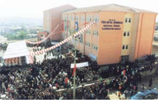
Mustafa Özbek İlköğretim Okulu