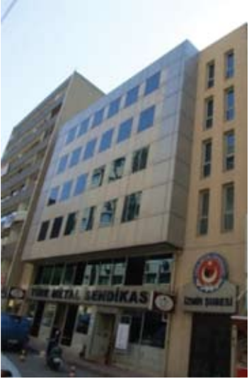
İzmir Sosyal Tesisleri

Binada aynı zamanda misafirhane, toplantı ve konferans salonu ve restaurant bölümleri bulunmaktadır.