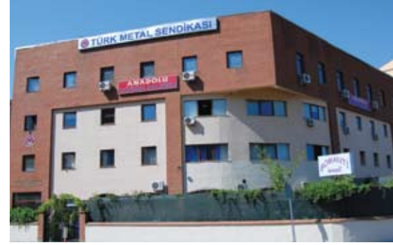
Eskişehir Sosyal Tesisleri

Binada aynı zamanda restaurant, cafeterya, düğün salonu, konferans salonu ve misafirhane bölümleri bulunmaktadır.