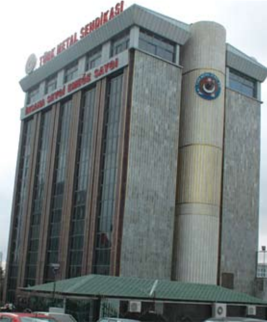
Ankara Genel Merkez Binası

T ürk Metal'in Ankara Söğütözü'ndeki hizmet binasının temeli 30 Kasım 1994 tarihinde atıldı. Bina, 1997 sonlarında hizmete hazır hale getirildi ve aynı yılın Aralık ayı içerisinde, Maltepe'de bulunan Genel Merkez, Söğütözü'ndeki binasına taşındı.