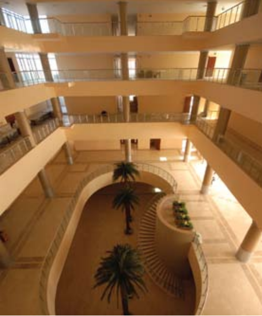
Büyük Anadolu Ereğli Otel Lobisi

Zonguldak ili Ereğli ilçesi Güllüç Belediyesi sınırları içerisinde, 22.000 m 2 yüzölçümlü arsaya inşaatı başlayan Büyük Anadolu Ereğli Otel projesi 2011 yılının ilk aylarında tamamlanarak metal işçilerinin hizmetine açıldı.